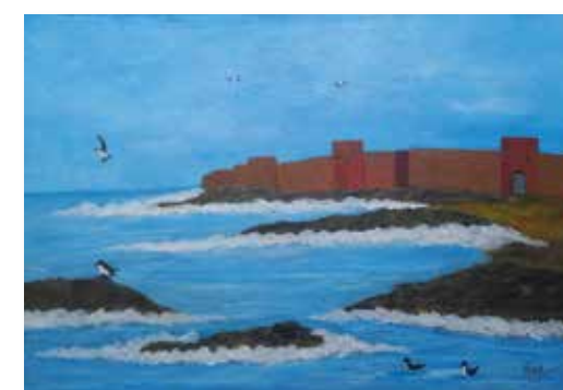
Muraille de mer, 38x55 cm, 2015, Peinture acrylique, support bois et toile