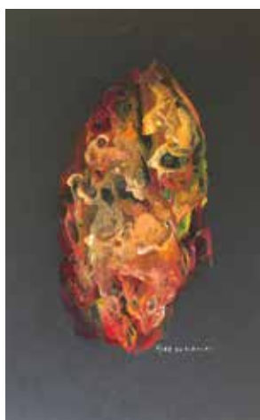
Naissance, 53x41 cm, 2014, peinture acrylique, support bois et toile

• 12 au 15 Septembre 2019 ART SHOW PARIS II ANGLE 15 RUE DES HALLES ET 11 RUE DES DÉCHARGEURS 75001 PARIS