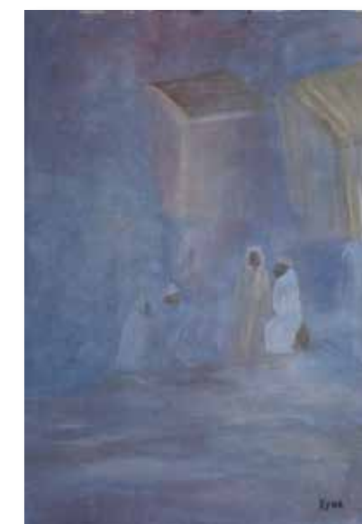
Caravansérail, 55x38 cm, 2016, Peinture acrylique, support bois et toile