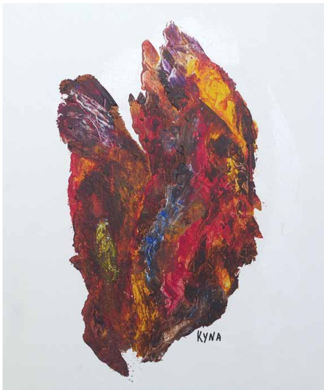
Commérages, 46x55 cm, 2015, Peinture acrylique, support bois et toile

La vie de cette artiste peintre exposée dans le monde entier et souvent récompensée pour son œuvre est un véritable roman.