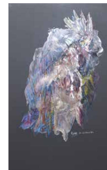
Les bêtes, 53x40.5 cm, 2000, Peinture acrylique, support bois et toile