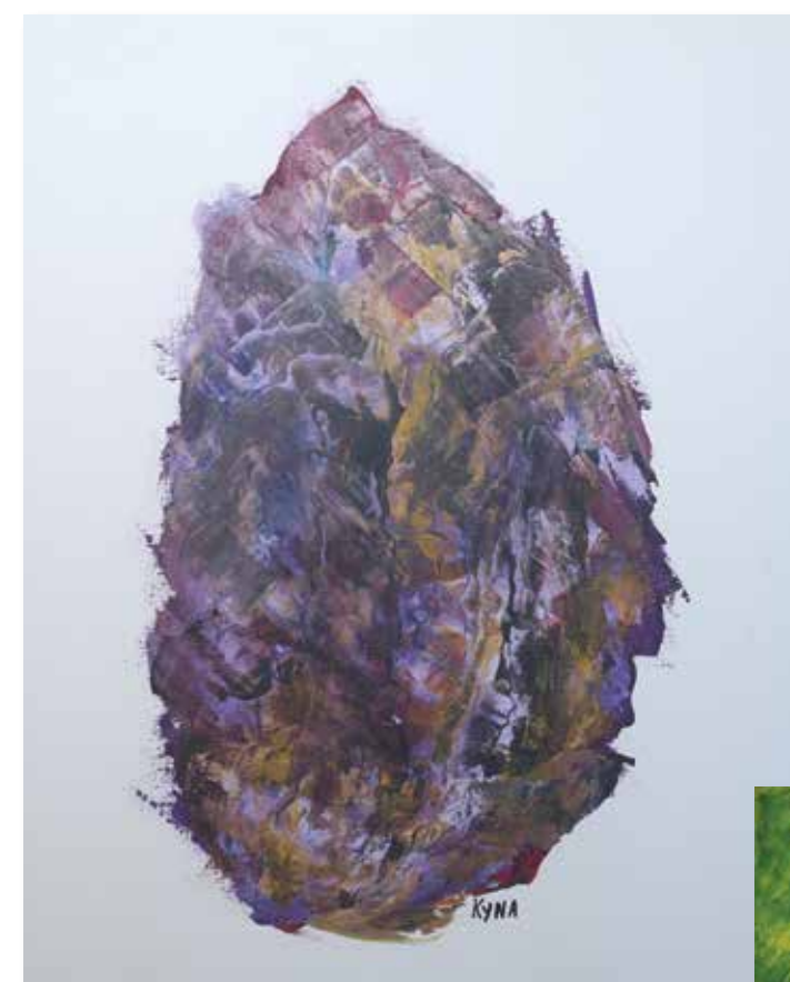
Homme médecine, 46x55 cm, 2015, peinture acrylique, support bois et toile

The artist enamoured with colours and who paints with a palette knife uses acrylic and beeswax to take us into sometimes-strange universe that invite us to dream, relax, and feel the joy of simply being.